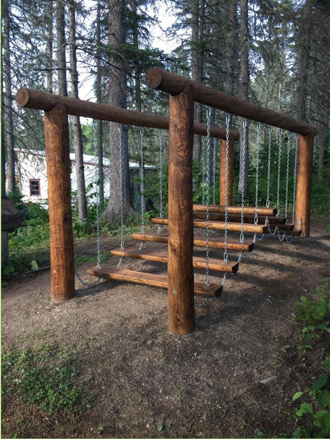
Le moulin à scie