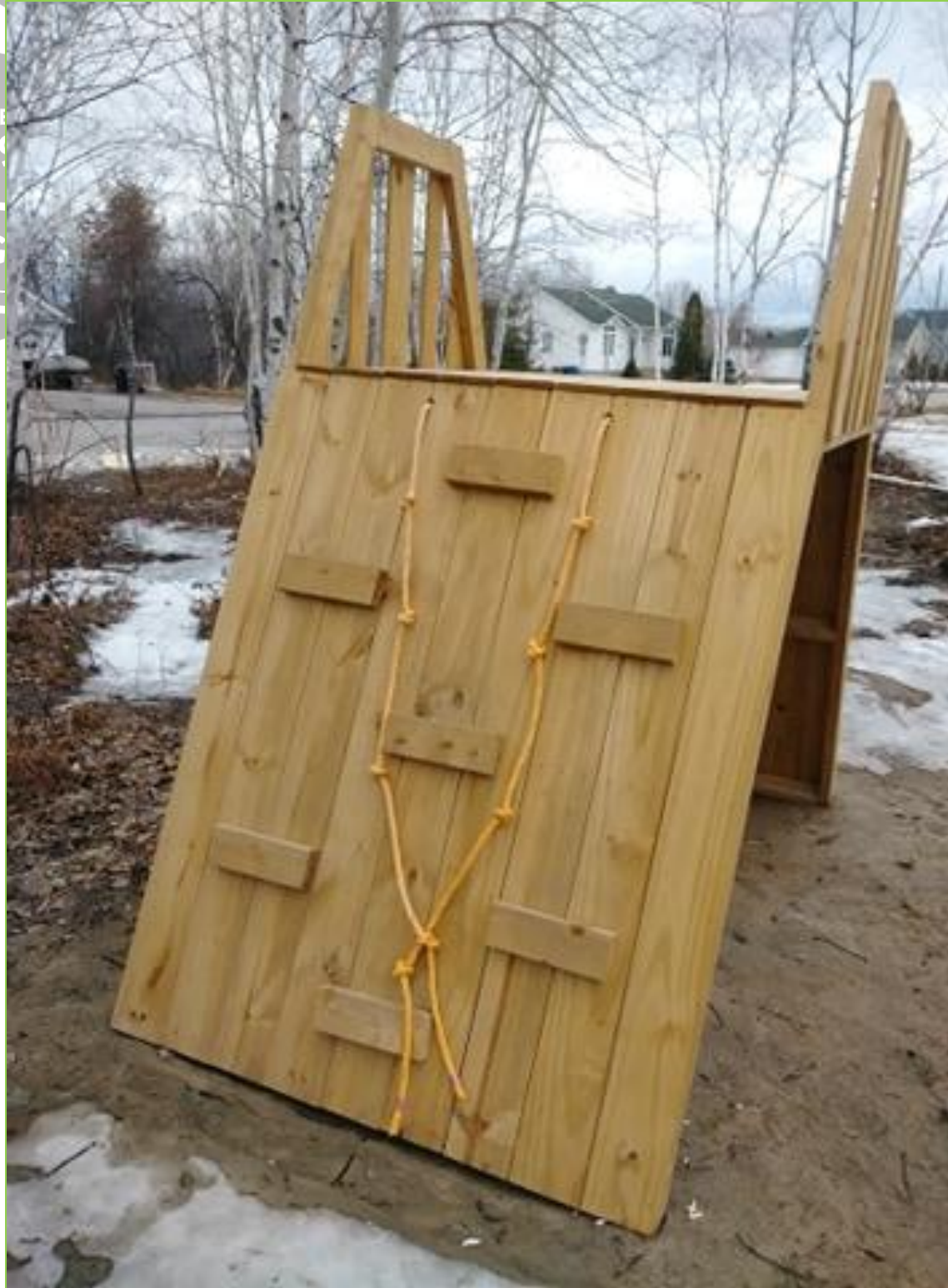
L'agrippeur et le mur