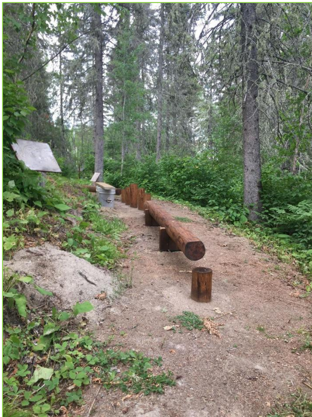
La poutre et la marelle