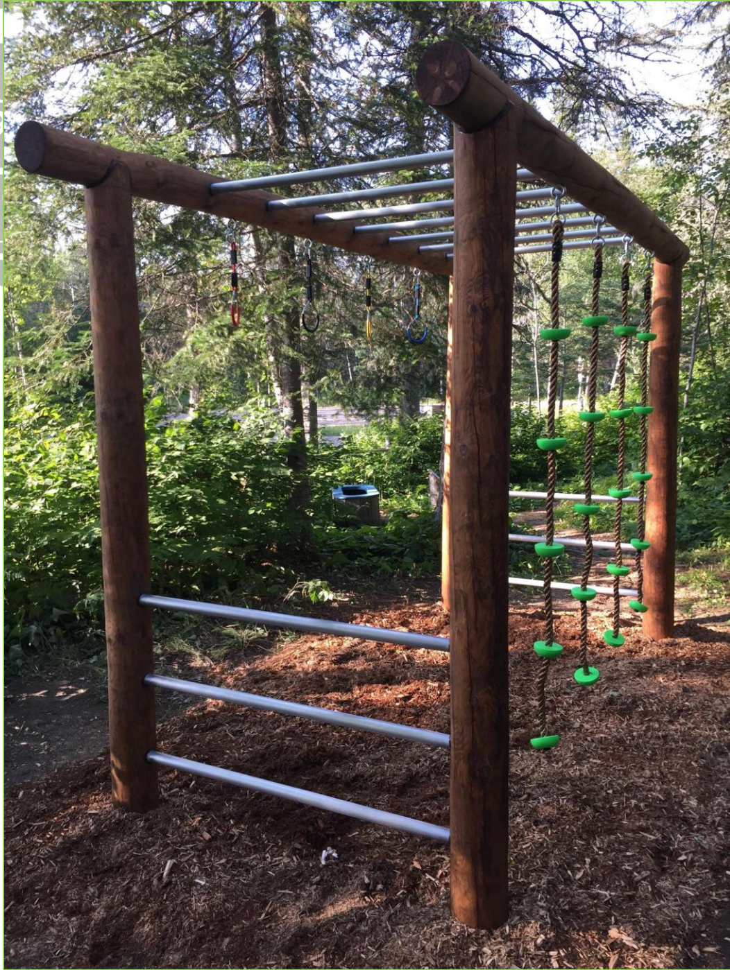
Le pont chinois