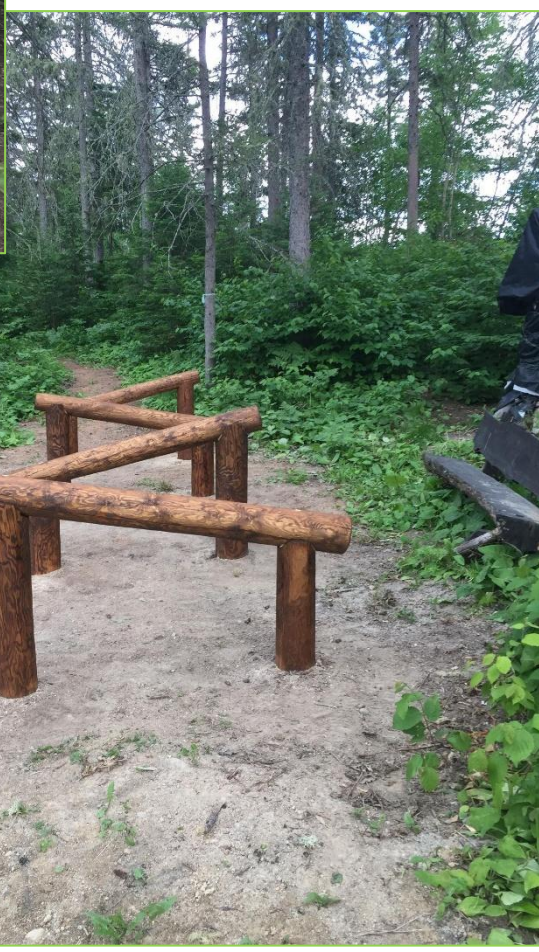
Le tipi et le portage