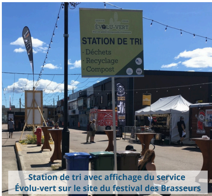
Station de tri avec affichage du service Évolu-vert sur le site du festival des Brasseurs

Vous pouvez consulter le guide, créé pour aider les organisateurs de mise en place des évènements écoresponsables, dans l'encadré «Pour aller plus loin» .