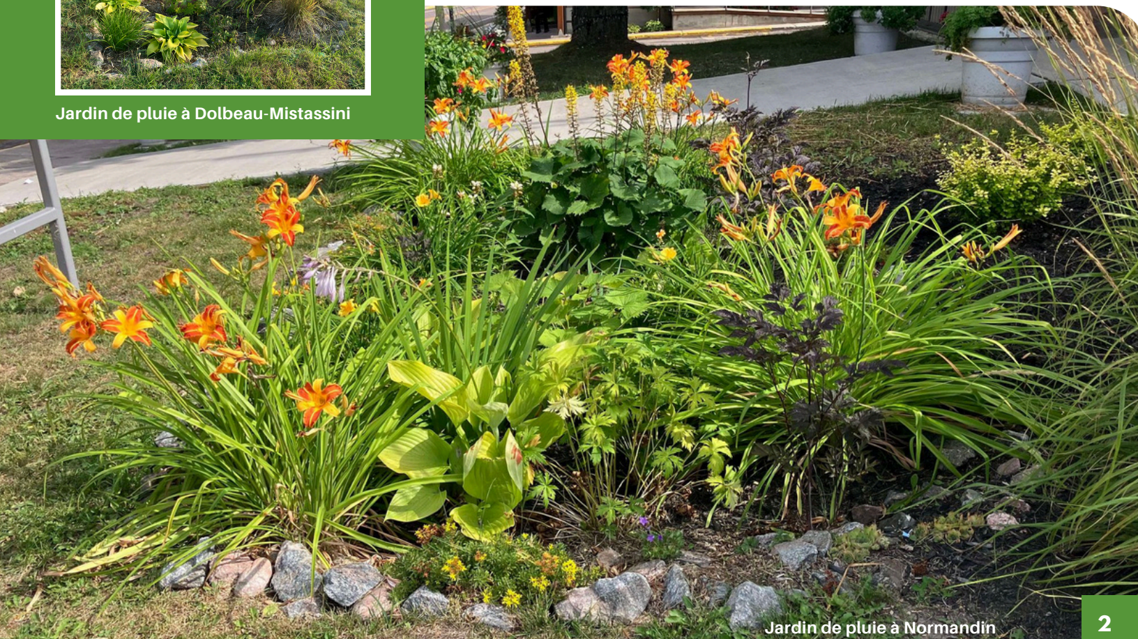
Jardin de pluie à Normandin