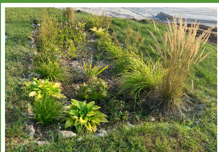
Jardin de pluie à Dolbeau-Mistassini